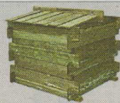
Stående behållare, två fack