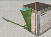
Stående behållare, bottenmatad